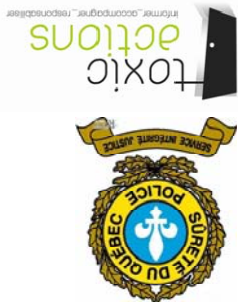
Table Concert Action Jeunesse Secteur Domaine-du-Roy

Centre de santé et de services sociaux Marie-Chapdelaine